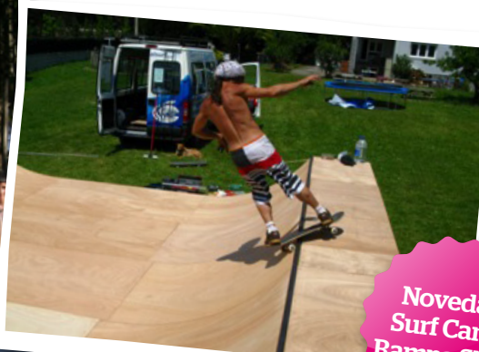
Novedad Surf Camp Rampa Skate