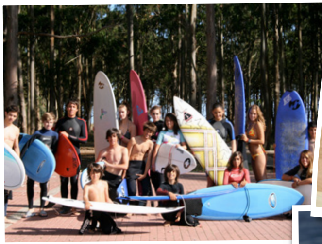
Un grupo de alumnos e instructores del Surf Camp 2009

Es por ello que las prestigiosas marcas Australianas, Billabong, Kustom y Element confiaron en nosotros como escuela oficial.