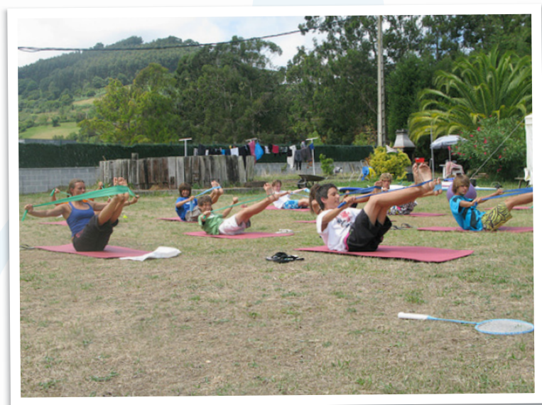
Trabajar sobre nuestro propio eje es complicado pero divertido.

Hoy en día cada vez son más personas las que confían en este método tanto para la higiene postural como para tonificar su cuerpo.